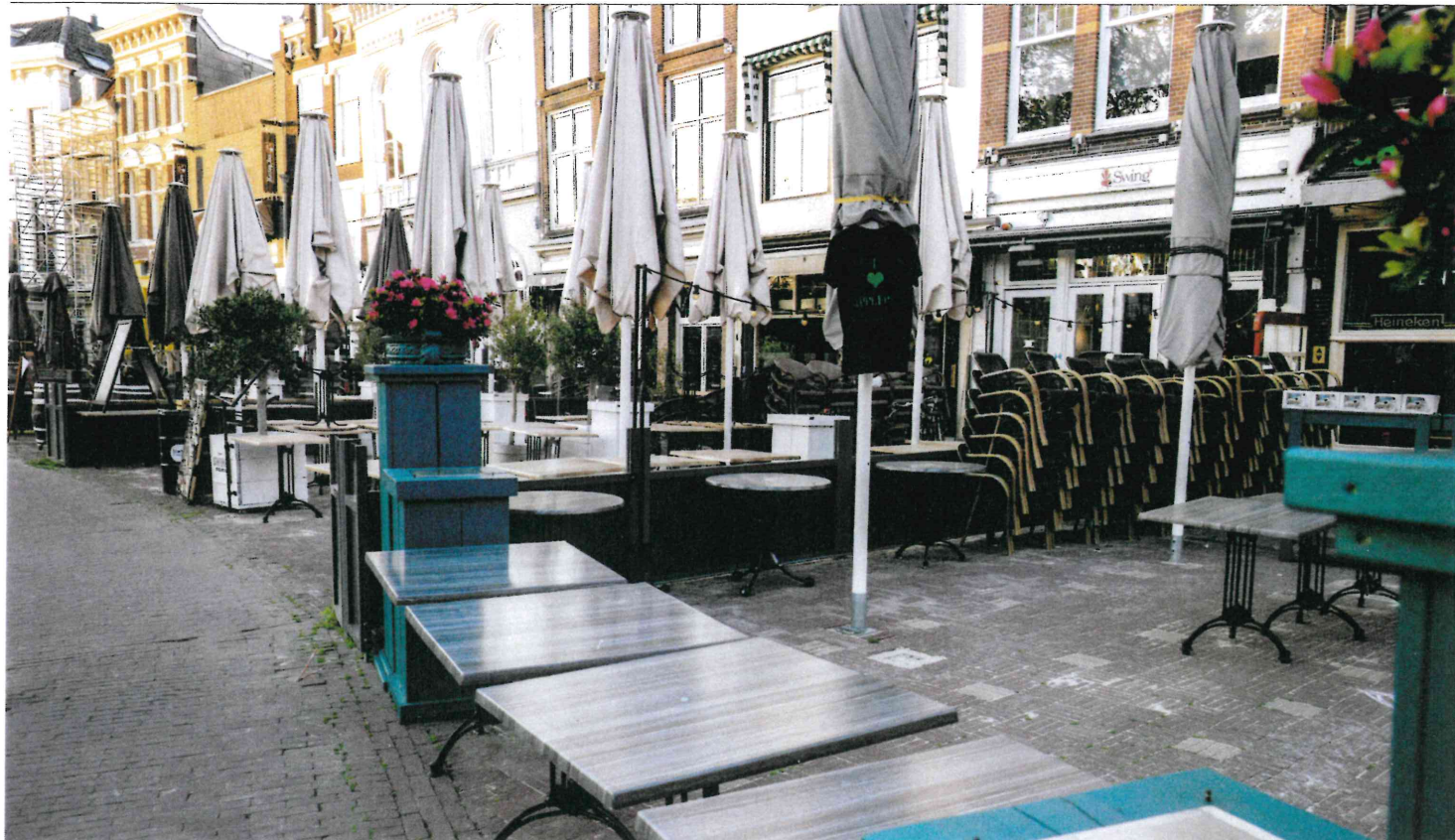
Goudse ondernemers, onder meer in de horeca, hebben het zwaar, blijkt ook uit de coronamonitor van de gemeente Gouda.

enigszins, en 28 procent vindt het virus redelijk tot heel bedreigend.